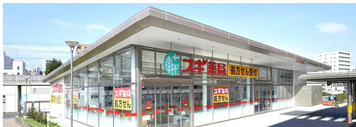
名大病院敷地内の「スギ薬局 名古屋大学病院店」